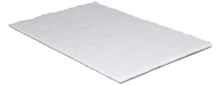
SOPREMA VELAPHONE FIBRE 22