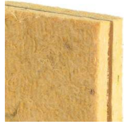
TECSOUND 2FT BARIYER TECSOUND 2FT BARRIER