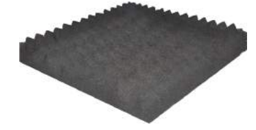
BAF PU/E FOAM